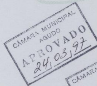
LAURO REINOLDO REETZ Prefeito Municipal