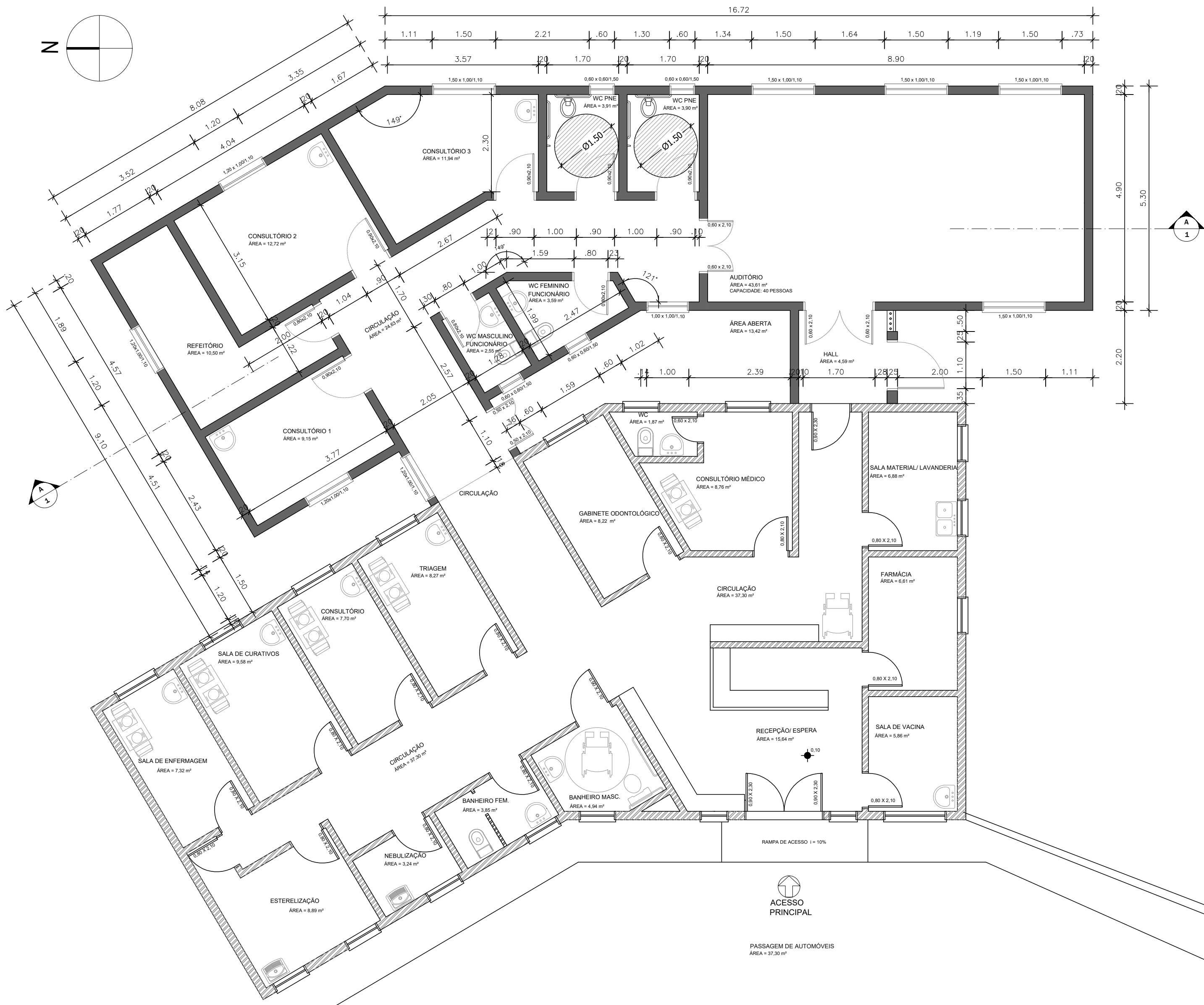
1 PLANTA AMPLIAÇÃO ESCALA: 1/75