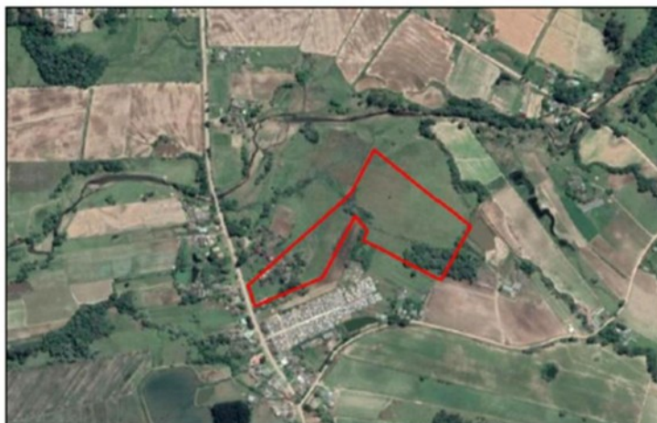
Imagem 3 – Localização da nova Zona de Expansão Urbana